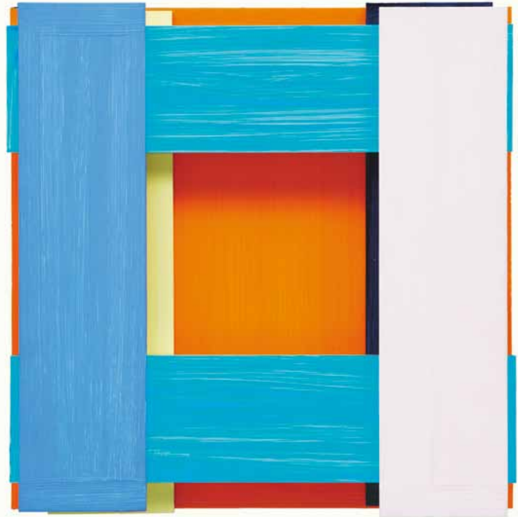
Imi Knoebel ›Face (6)‹ 2003, Acryl auf Aluminium, 40 x 40 x 9 cm

1969) und Hans Hartung (1904–1989) zählen ebenfalls zu den Künstlern, die ihre Bildsprache bereits vor dem Zweiten Weltkrieg entwickelt hatten, aber erst danach bekannt wurden. Beuys-Schüler Imi Knoebel (*1940) gehört dagegen zu der jüngeren Generation, in der ›Abstraktion per se, als genuine Setzung oder gar Erfindung nicht mehr denkbar war‹ (Kay Heymer). Knoebels Arbeiten sind Kunstwerke, die in der Tradition der Tafelmalerei stehen und von Malern wie Kasimir Malewitsch (1879–1935) oder Piet Mondrian (1872–1944) inspiriert wurden. Seine Werke – sie lassen an Skulpturen oder Installationen denken – setzt er aus Farben und unterschiedlichen Materialien, ja sogar aus Aluminiumschienen zusammen, wie die farbenfrohe Arbeit ›Face (06)‹ aus dem Jahr 2003 zeigt. Alle Kunstwerke hängen in der