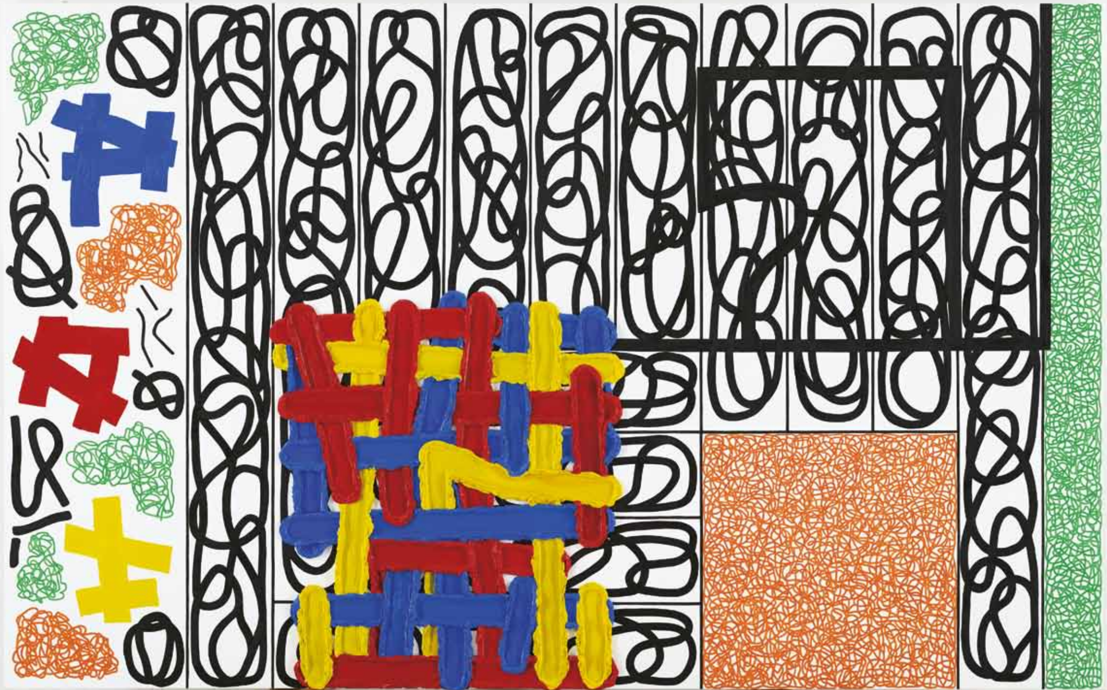
Jonathan Lasker ·The Boundary of Luck and Providence· 2011, Öl auf Leinwand 191 x 305 cm (Galerie Thaddaeus Ropac, Salzburg). Der Amerikaner, Jahrgang 1948, ist ein bedeutender zeitgenössischer Vertreter der Abstraktion. Lasker zitiert die Farben Mondrians und

den abstrakten Expressionismus und ergänzt diese Versatzstücke mit eigenen formalen Erfindungen. Seine Bilder wurden als ‚Commedia dell’arte‘ der Kunst bezeichnet.