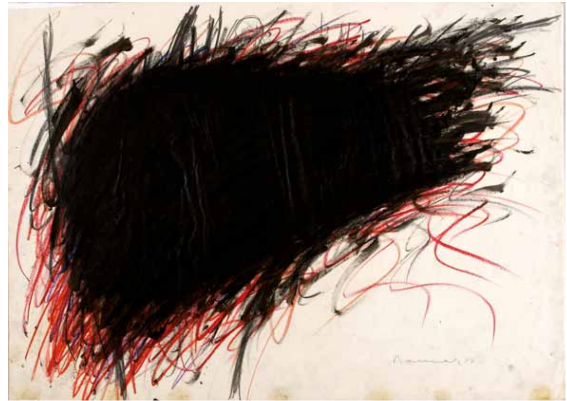
Arnulf Rainer ›Ohne Titel‹ 1957, Ölkreide, Tusche auf Papier, 50 x 70 cm © Atelier Arnulf Rainer. Foto: Robert Zahornicky

Als in den 1960er Jahren in Amerika bereits die Pop-Art zu reüssieren begann, wandten sich deutsche Künstler dem