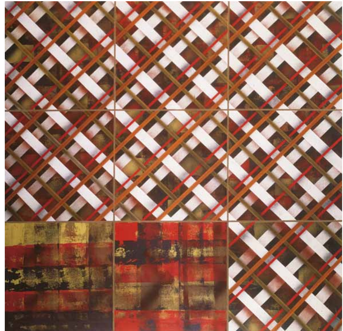
Sean Scully ›Change I‹ 1975, Print

Dem irischen Künstler Sean Scully (*1945), der zu den renommiertesten abstrakten Malern der Gegenwart zählt, widmet sich die Kunsthalle Rostock mit einem repräsentativen Querschnitt aus seinem Schaffen (1. März bis 3. Mai). Charakteristisch für Sean Scully ist ein wiederkehrender, vibrierender Bildaufbau in vertikalen und horizontalen Farbbahnen. In Rostock werden neben neuesten auch weniger bekannte und überraschende Arbeiten gezeigt. Sie verdeutlichen die Entwicklung Sean Scullys vom Figurativen zum Abstrakten. Zu den aktuellen Serien des Künstlers zählen Werke, in denen der Farbe als Medium des Lichts eine gesteigerte Bedeutung zukommt. Sean Scullys großformatige, manchmal mehrteilige Gemälde und seine bekannten