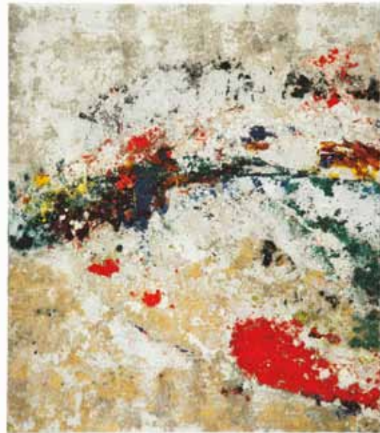
Rainer Gross ›Lukas Twins‹ 2007

Galerie Koch Di-Fr 10-18 Uhr Sa 11-14 Uhr Königstraße 50 D-30175 Hannover