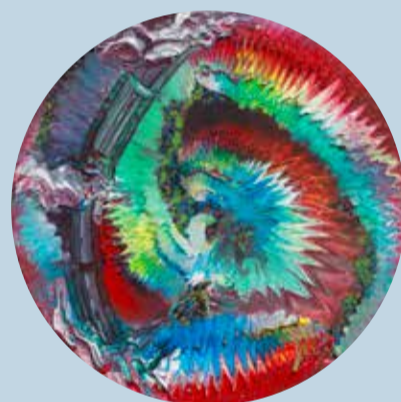
Dynamite Bamboo Bubble, 2017, Öl auf Nessel, Durchmesser 70 cm