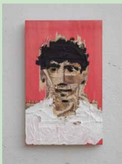
o.T., 2018, Sperrholz, Farbe, 40/25/2 cm