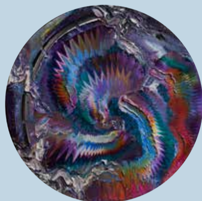
Big Jelly Doughnut Bamboo Bubble, 2017, Öl auf Nessel, Durchmesser 100 cm