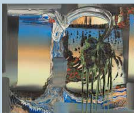
Surprise, 2015, Öl auf Nessel, 50 x 60 cm