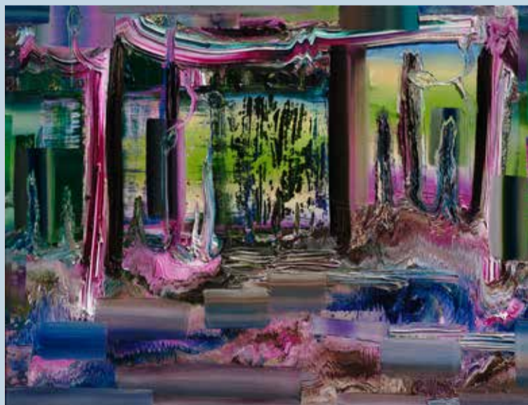
Surprise, 2015, Öl auf Nessel, 160 x 210 cm