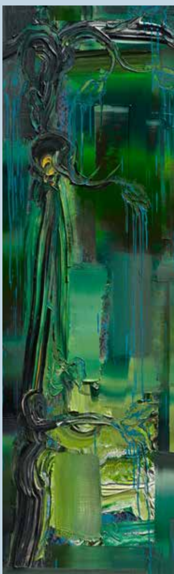
Surprise, 2015, Öl auf Nessel, 160 x 50 cm