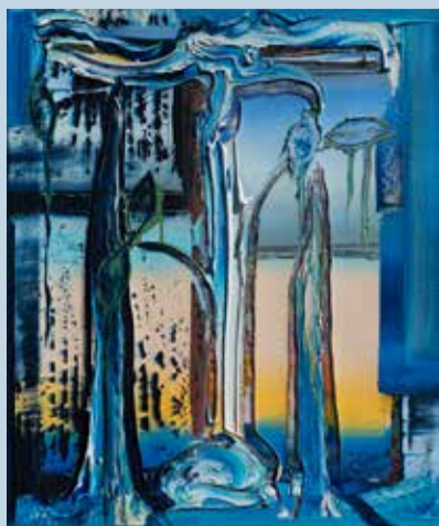
Tomorrow, 2017, Öl auf Nessel, 60 x 50 cm