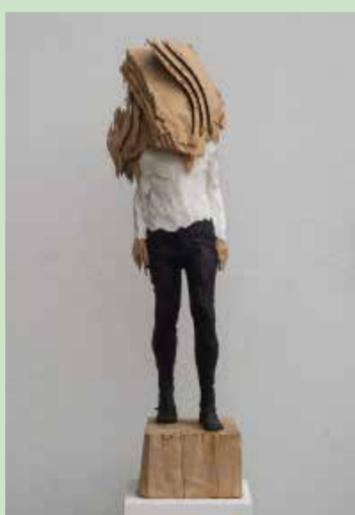
o.T., 2018, Esche, Farbe, 108/35/35 cm