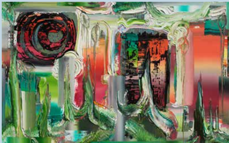
Surprise, 2016, Öl auf Nessel, 100 x 160 cm