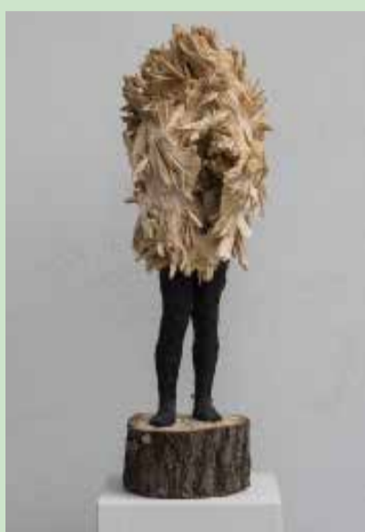
o.T., 2016, Linde, Farbe, 81/30/30 cm

Unikate: Holzskulpturen und -reliefs, bemalt.