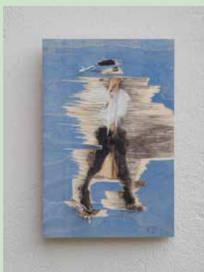
o.T., 2018, Sperrholz, Farbe, 18/27/2 cm