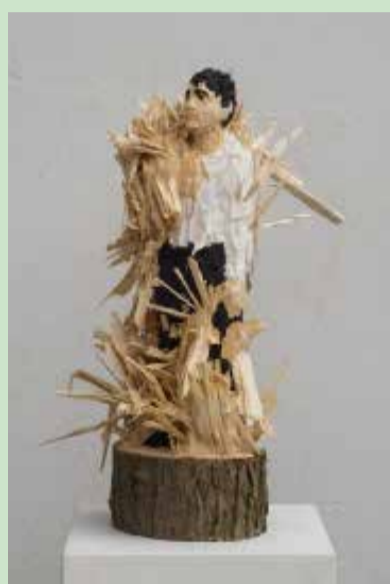
o.T., 2018, Linde, Farbe, 55/30/24 cm