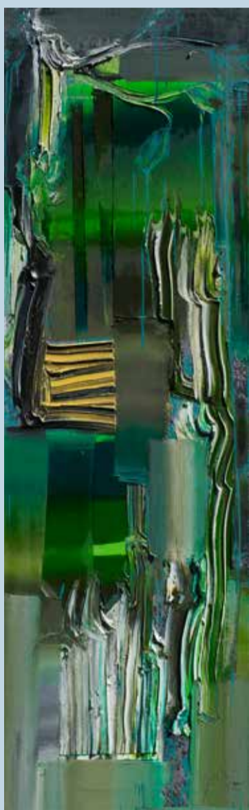
Surprise, 2015, Öl auf Nessel, 160 x 50 cm