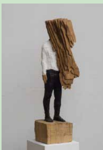
o.T., 2016, Eiche, Farbe, 96/30/26 cm