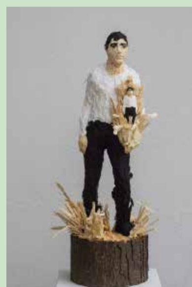
o.T., 2018, Linde, Farbe, 72/30/25 cm

Die Galerie am Dom und Artherb laden zur Nacht der Galerien in Wetzlars Altstadt ein.