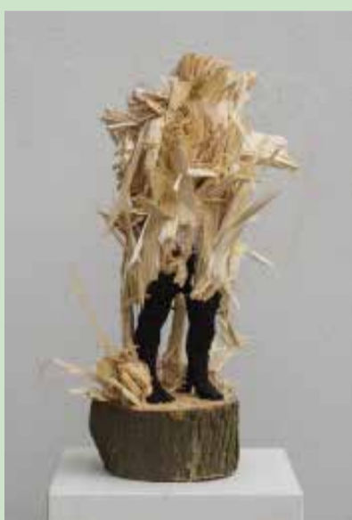
o.T., 2018, Linde, Farbe, 52/32/24 cm